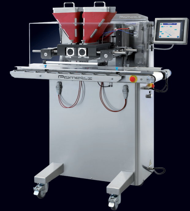
OSD-0 mm 960x500x1450